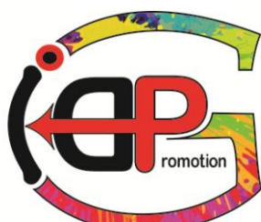
ID PROMOTION GROUP SRL